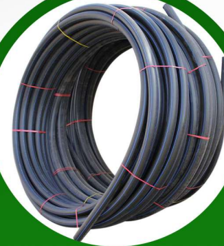
لي 1 بوصة 6 بار 100 متر