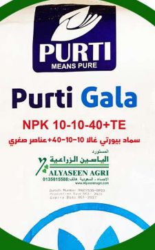
بيورتي غالا 40-10-10