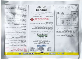
مبيد سوبر كنديور