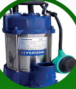
غطاس 1.50 حصان هونداي ضمان 2 سنة