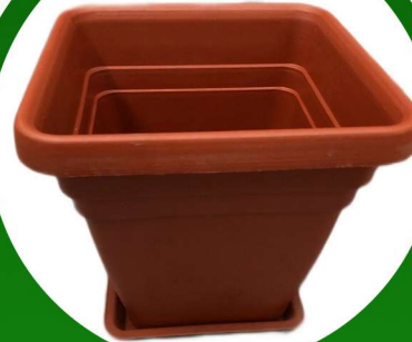
مركن زراعي مقاس 25