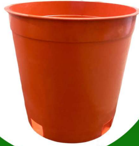
مركن زراعي مقاس 16