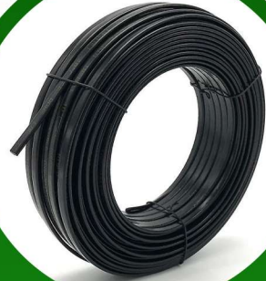
لي 1.50 بوصة 6 بار 100 متر