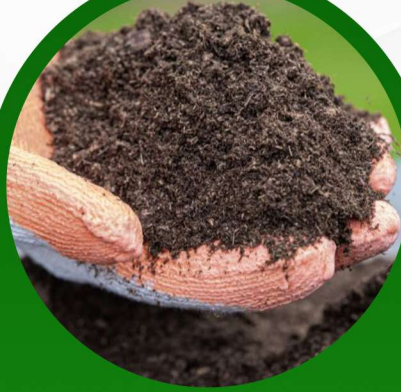
بيتموس 40 لتر