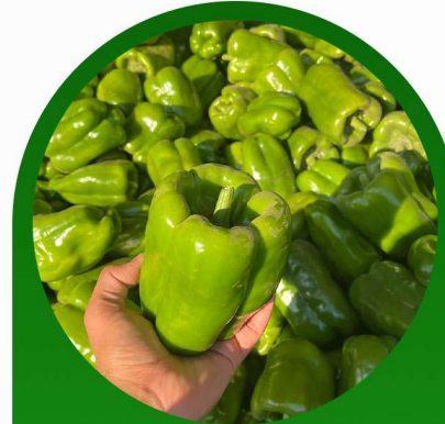
فلفل رومي جرين روك