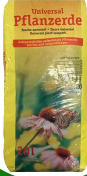
بوتنج سويل 20 لتر