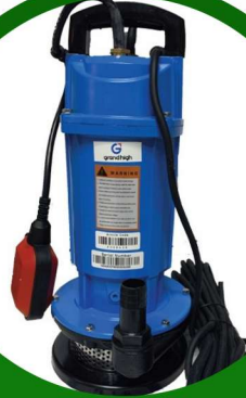
غطاس تيوب 3 حصان صيني ضمان مصنع