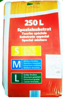
بيتموس 250 لتر