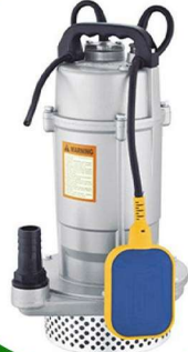
غطاس 1 حصان ايطالي