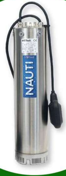
غطاس 3 حصان ايطالي كورفيكو