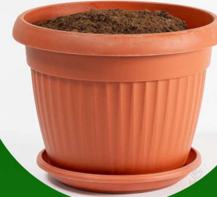
مركن زراعي مدور