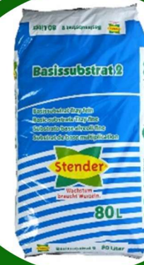
بيتموس 80 لتر