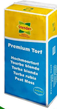
بيتموس 300 لتر