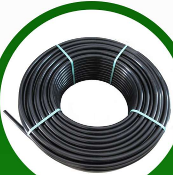
لي 2 بوصة 6 بار 100 متر