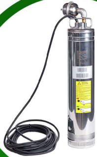
غطاس 2 حصان ايطالي كورفيكو