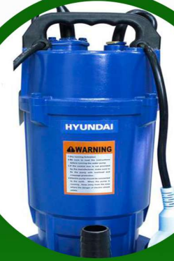
غطاس 7.50 حصان هونداي ضمان سنين