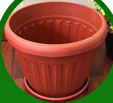
مركن زراعي مدور كبير