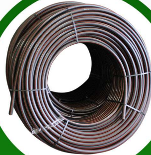
لي 1.25 بوصة 6 بار 100 متر