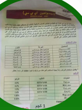
ديسولفين اي بي سي حديد عناصر صغري