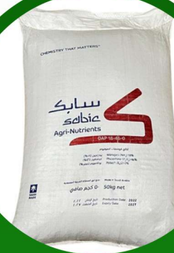
سماد مركب داب