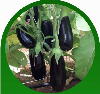
باذنجان بلاك بيرل