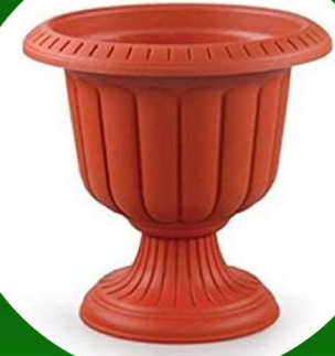
مركن زراعي مقاس 35