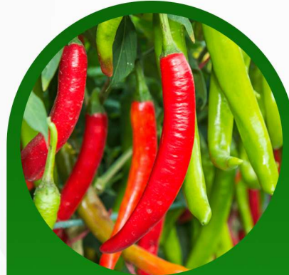
فلفل حار باشن