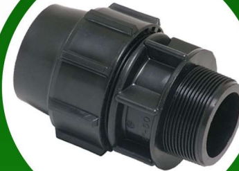
بدايه 1 بوصة سن خارجي