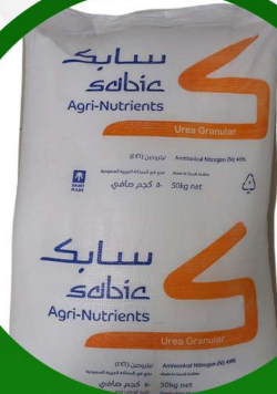
سماد يوريا محيب