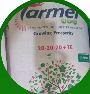
مركب NPK 20-20-20