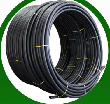
لي 1 بوصة 10 بار 100 متر