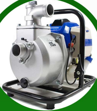
مضخة مياة 1/4 حصان هونداي ضمان 2 سنه