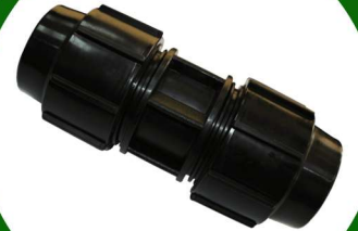
وصله ربط 1 بوصة