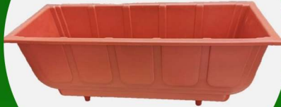
مركن زراعي مستطيل كبير