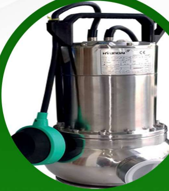
غطاس 5.50 حصان هونداي ضمان 2 سنة