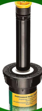
رشاش 3/4 رين بيرد