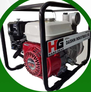
مضخة مياة 4 بوصة ياباني