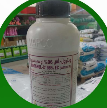
مبيد ونترول اس