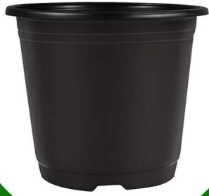
مركن زراعي مقاس 12