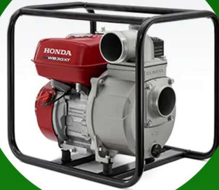
مضخة مياة 3 بوصة هونداي ضمان 2 سنه